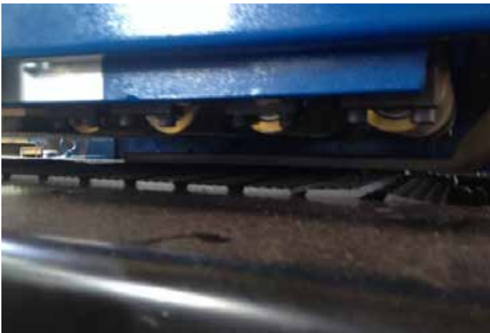
Role presoare la intrare și ieșire