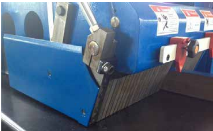
Sistem anti-recul la intrare