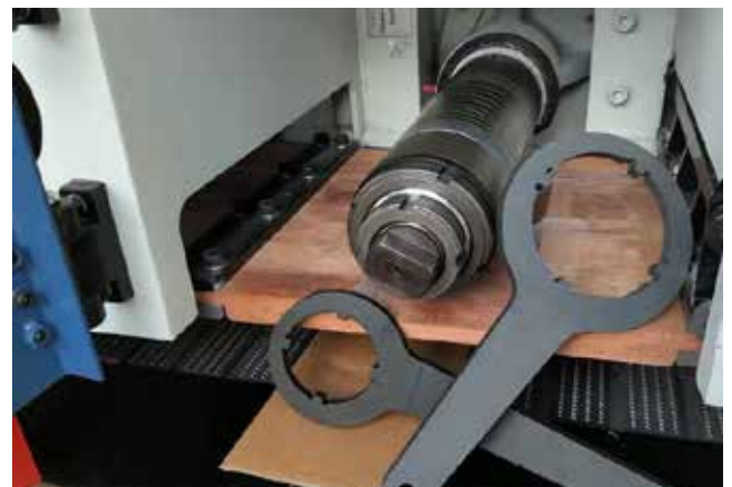
Bucșă cu inele distanțiere și set de chei